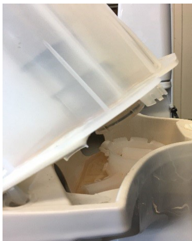
↑ Sæt pumpe hjulet på igen ved at trykke det på ned imod en hård overflade, til det gir et lille klik.