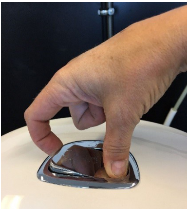
↑ Demonter pumpen under kabinen.

For at Ifös afløbspumpe til brusekabiner kan fungere optimalt, skal der altid være monteret en hår si i kabinen, da hår omkring pumpeakselen er den hyppigste årsag til at pumpen holder op med at fungere. Skulle der have sat sig hår i pumpen renses således: