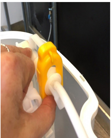
↑ Rens akslen fuldstændig for hår der har at sig rundt om akslen.