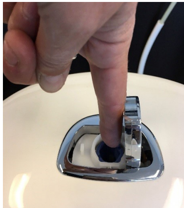
↑ Skrue de 3 skruer der holder pumpehuset ud.